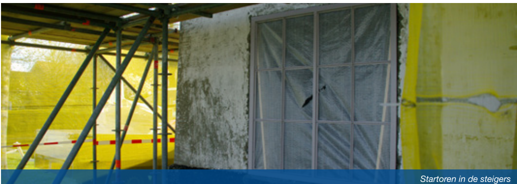
Startoren in de steigers

De renovatie van de Startoren verloopt spoedig en zal binnen het budget uitgevoerd kunnen worden. Het dak van de Startoren werd bewoond door torren en moest helaas vernieuwd worden.