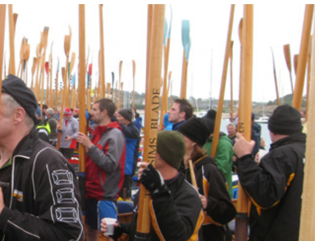
'Oars up' als begroeting bij de start van de Final Race.