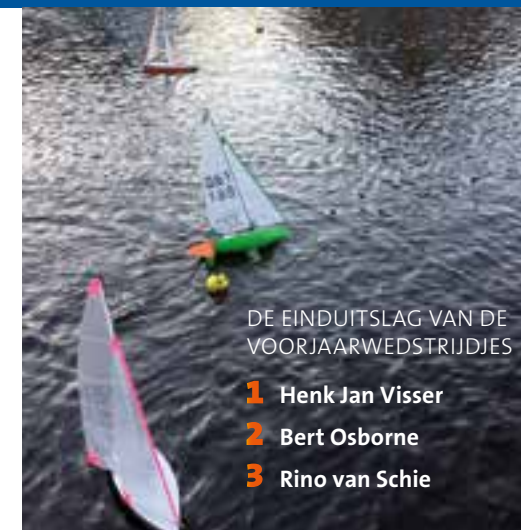
DE EINDUITSLAG VAN DE VOORJAARWEDSTRIJDJES

Nog 30 seconden, iedereen vaart zenuwachtig voor de startlijn langs om een goede positie te kiezen om te starten. Het is 8 graden, maar droog en er is genoeg wind. De baan voor de laatste wedstrijd is uitgelegd op de "Does" in Hoogmade en de wind draait hier soms 180 graden ivm de huizen, die deze mooie vaart rijk is. Nog 3, 2, 1 en het startsignaal is gegeven. De bootjes vliegen over de start, de een over bakboord, de ander over stuurboord vanwege de draaiende wind, met 11 man en een jongedame aan de zenders om alles in goede banen te leiden. De strijd is duidelijk aanwezig, vooral bij de bovenboei, die iedereen gezamenlijk probeert te ronden. Er is een mooie lange baan uitgezet, die moeilijk te bezeilen is, niet alleen vanwege de rare wind, maar er is ook nog stroming aanwezig. De echte topzeilers klagen steen en been, maar weten toch weer goed