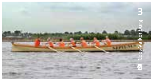
3 Cees Valkenburg