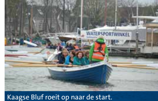
Kaagse Bluf roeit op naar de start.