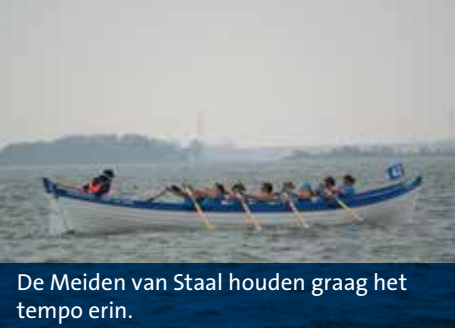
De Meiden van Staal houden graag het tempo erin.