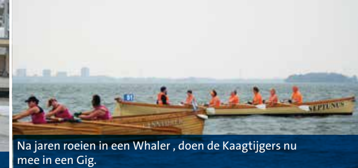
Na jaren roeien in een Whaler, doen de Kaagtijgers nu mee in een Gig.