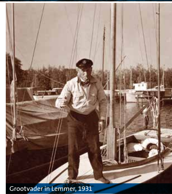
Grootvader in Lemmer, 1931

Op zaterdag 24 juni 2017, mijn bekertje had net zijn 20e Lustrum gevierd, was het zover. Mijn Medisch Dispuut 'Hippocrates' vierde die dag zijn 28e Lustrum ('baas boven baas'), o.a. met een lunch op de Kaagsociëteit. In de prijzenkast zag ik twaalf vrijwel identieke bekertjes staan, de oudste uit 1919. Natuurlijk vergat ik mijn windjack en op 15 juli ontmoette ik bestuurslid