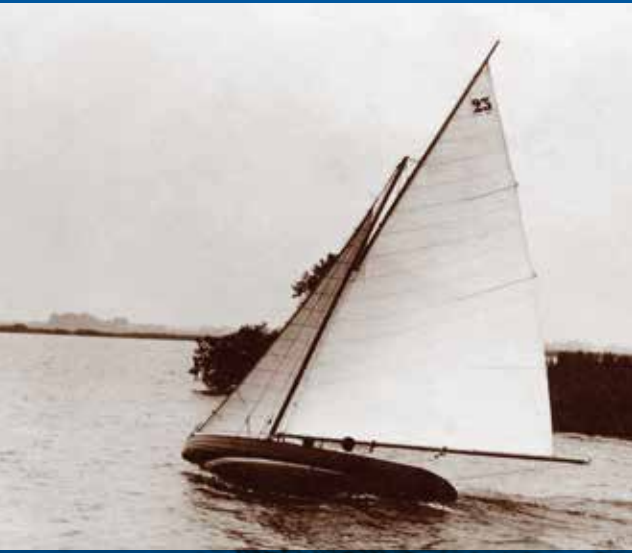
De Ingeborg, tijdens een zeilwedstrijd op de Kaag in 1912