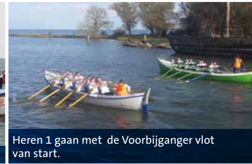
Heren 1 gaan met de Voorbijganger vlot van start.