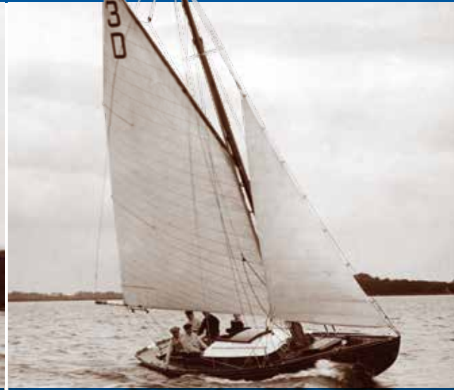
Zeilwedstrijd met De Norremeer in 1917