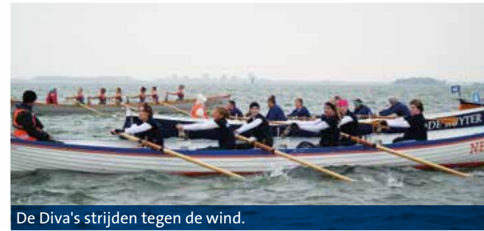
De Diva's strijden tegen de wind.