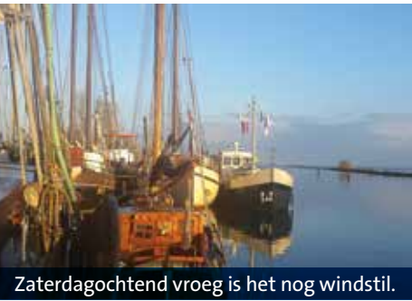
Zaterdagochtend vroeg is het nog windstil.

Met vijf teams was De Kaag vertegenwoordigd in Muiden. Hoe wisselend kan het eind november zijn: zon en regen, wind en storm, vlak water en hoge golven. Eten en slapen in de driemaster Nil Desperandum, een gouden formule. ■