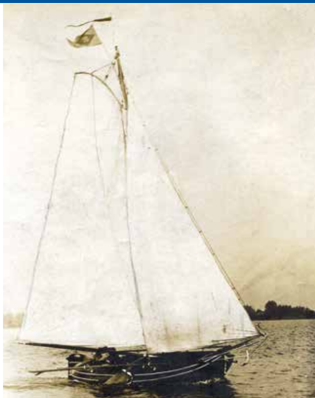
De Geisha, een fries jacht