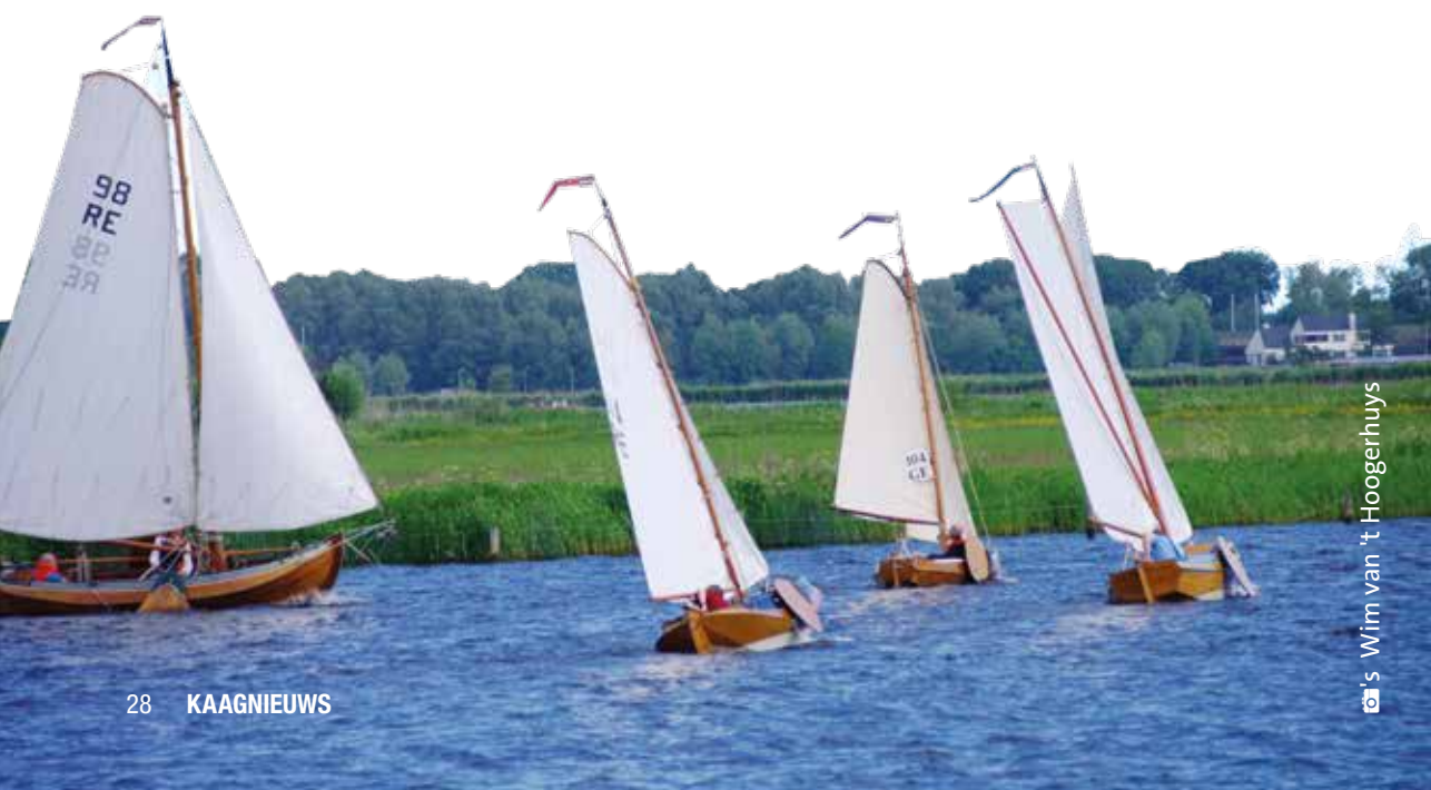
Wim van 't Hoogerhuys