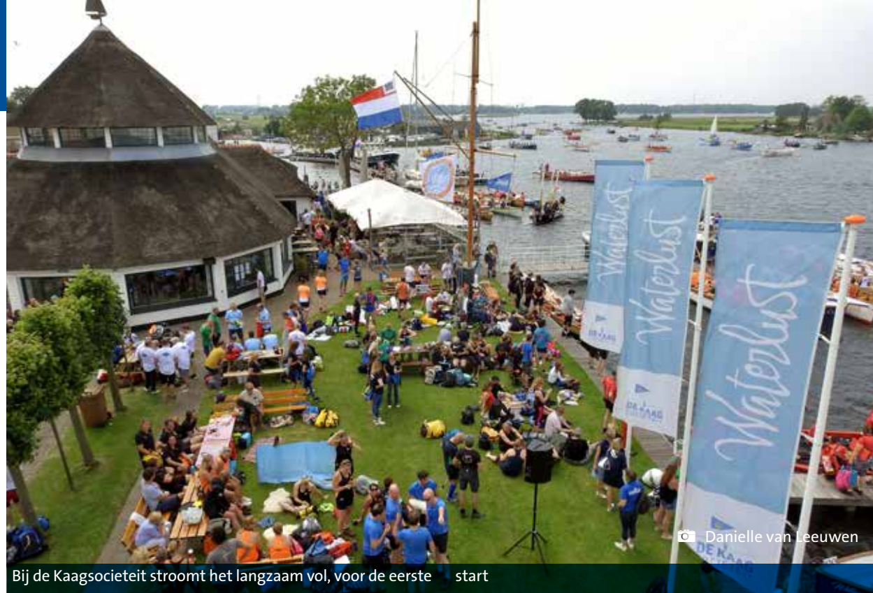
Bij de Kaagsocieteit stroomt het langzaam vol, voor de eerste start