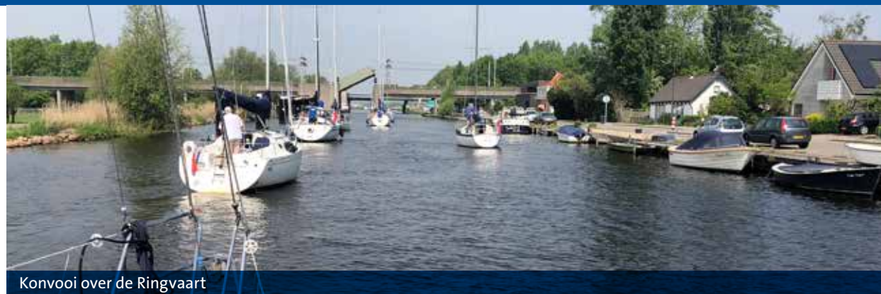
Konvooi over de Ringvaart