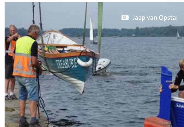
Kaagschuimers takelen op de dijk