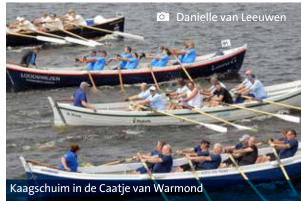
Kaagschuim in de Caatje van Warmond