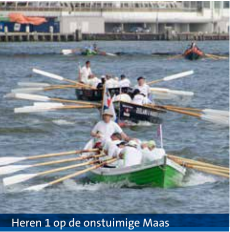
Heren 1 op de onstuimige Maas