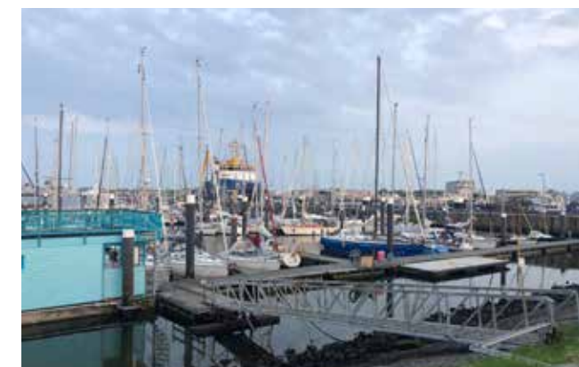
Marinehaven Den Helder