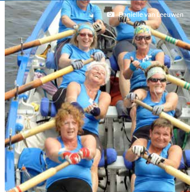
Meiden van Staal op de Leede, laatste kilometers