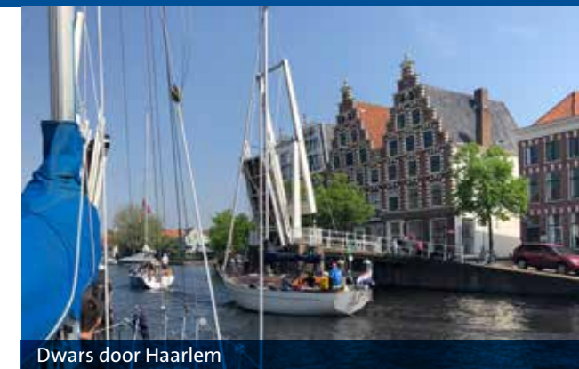
Dwars door Haarlem