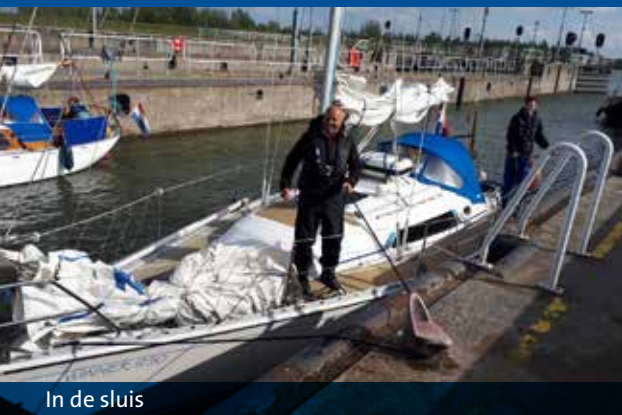
In de sluis