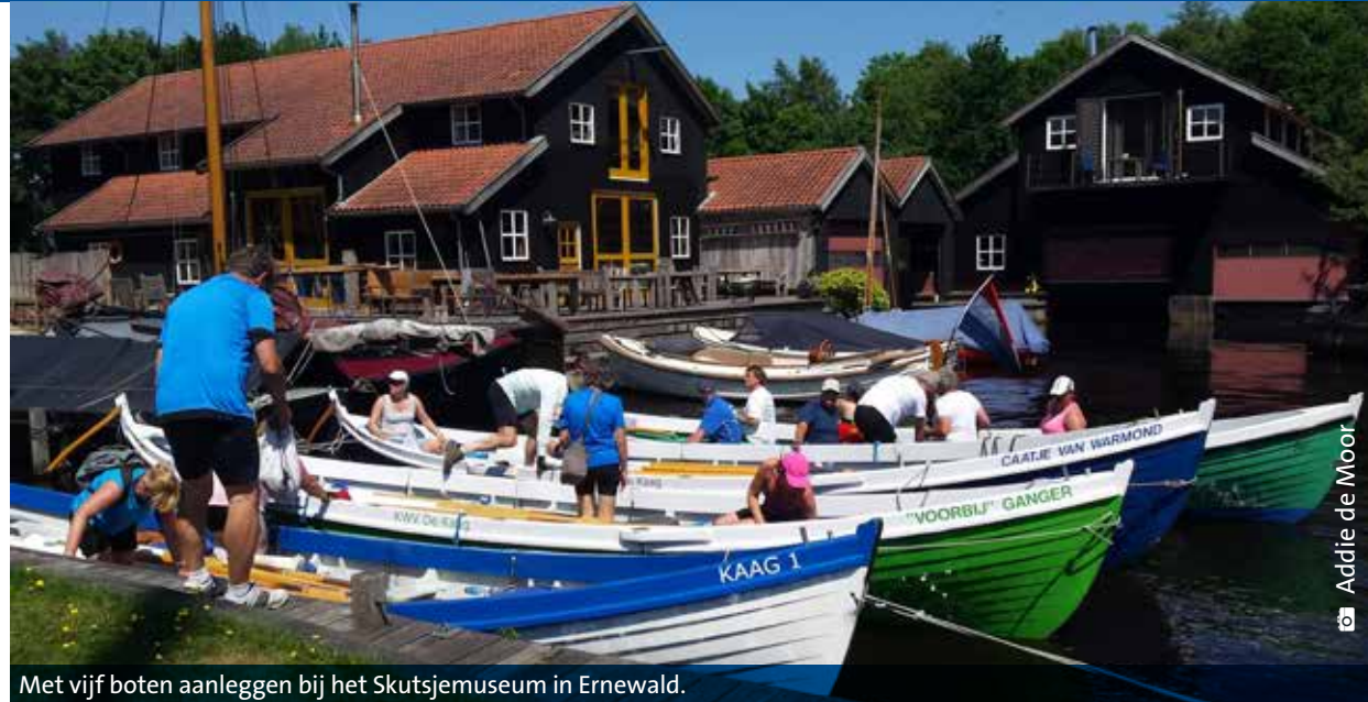
Met vijf boten aanleggen bij het Skutsjemuseum in Ernewald.

Zaterdag. De dagindeling begint zoals elke dag met 7 uur: wakker, 8 uur: ontbijt en palaver en 9 uur in de boot. Vanuit Akkrum gaan we richting Terherne