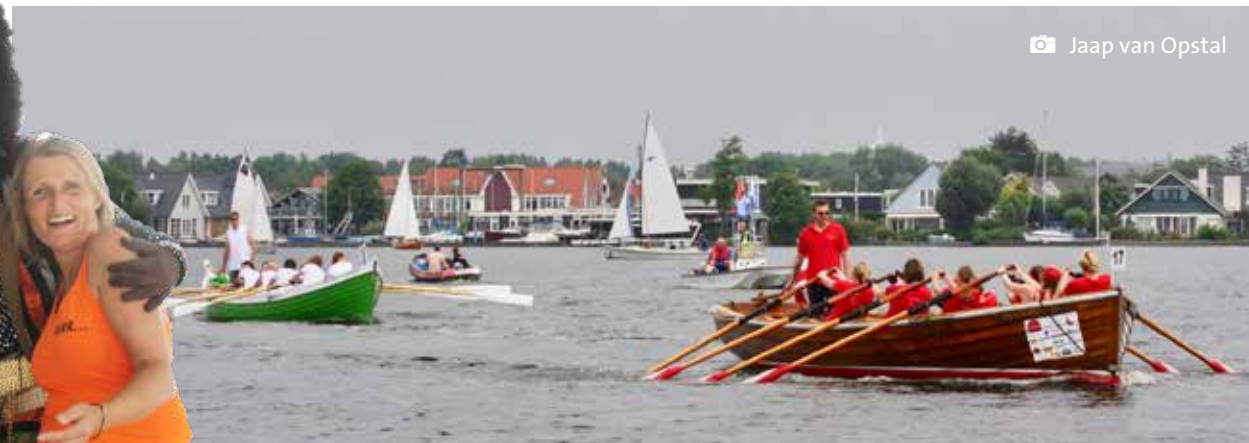
Kaegerslagh in de Voorbijganger bij Kaageiland