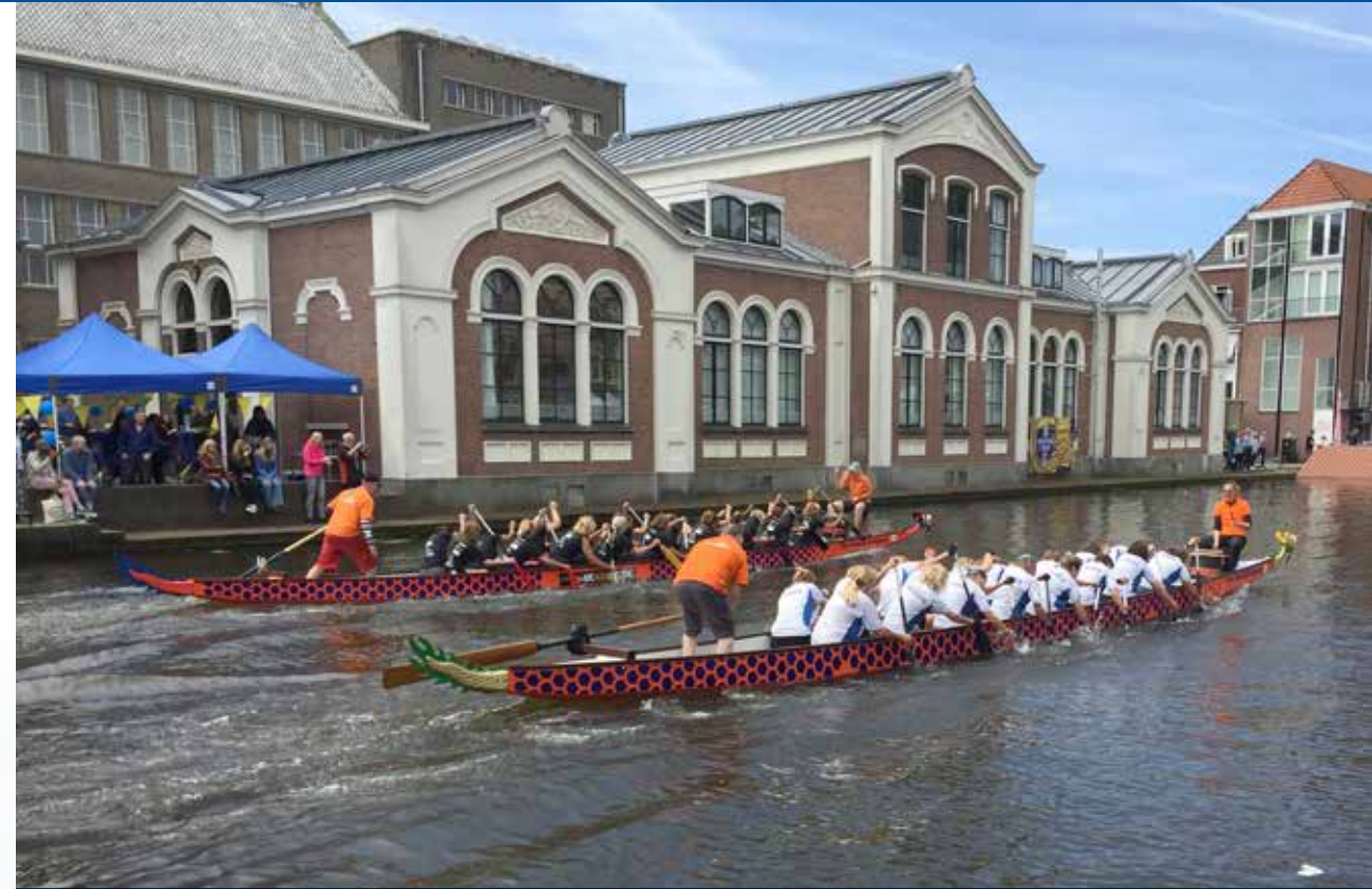
Rechts het damesteam van De Kaag