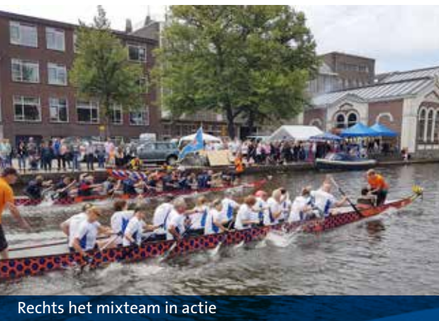
Rechts het mixteam in actie