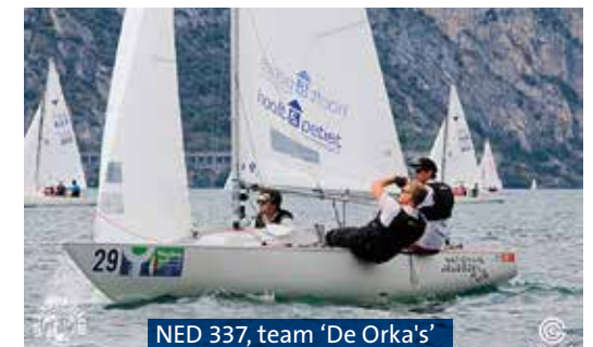
NED 337, team 'De Orka's'