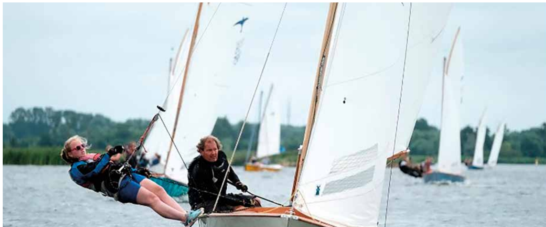
Floor in actie!