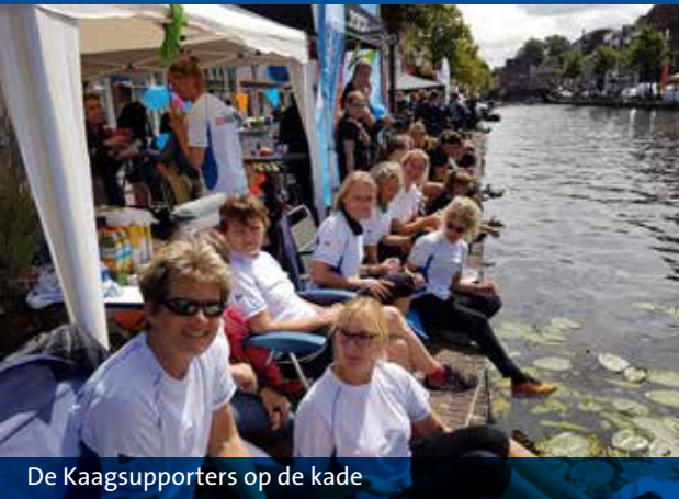
De Kaagsupporters op de kade