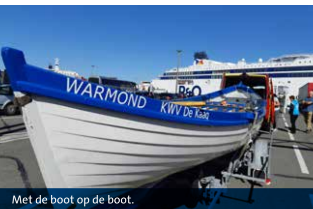
Met de boot op de boot.

› de hele wedstrijd roeien. Halverwege zullen we vanuit de punt een soepele roeierswissel doen, die maakt dat we ook allemaal op de Thames hebben geroeid!