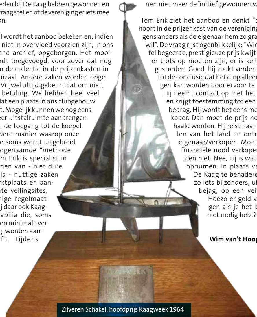
Zilveren Schakel, hoofdprijs Kaagweek 1964