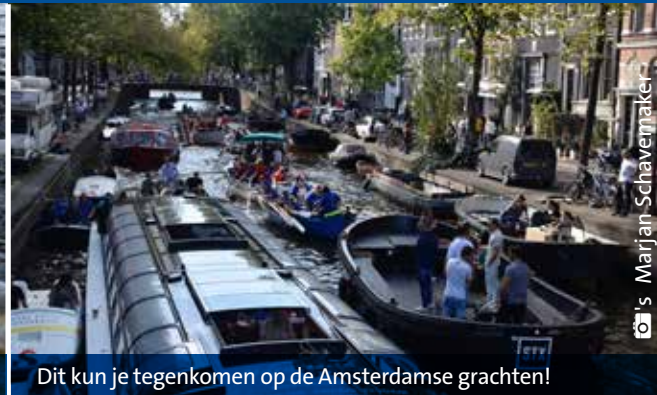
Dit kun je tegenkomen op de Amsterdamse grachten!