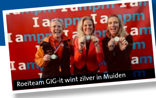
Roeiteam GIG-it wint zilver in Muiden