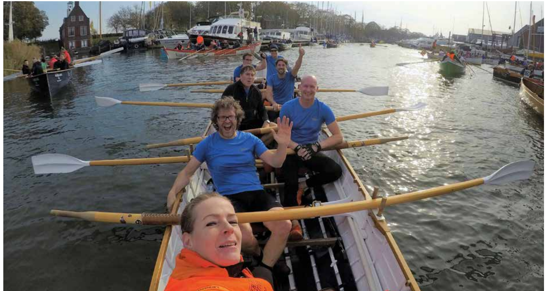
Team Alleman is er klaar voor!