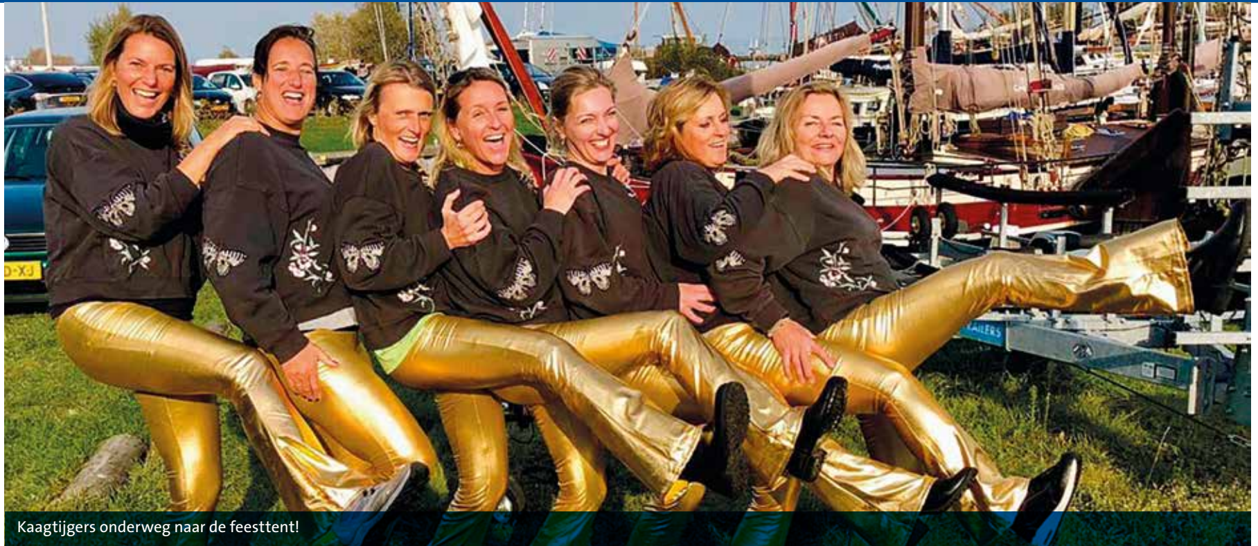
Kaagtijgers onderweg naar de feesttent!