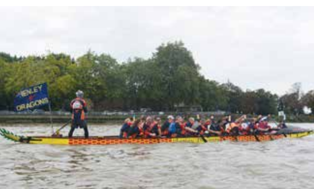
Ook drakenboten legden de 34 kilometer af.