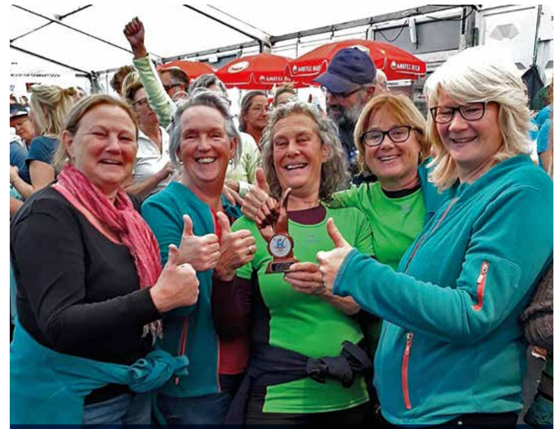
Brons voor de Kaagse Bluf.

's Avonds is de haven en omgeving sprookjesachtig. Een pracht gezicht: de roeisloepen hutjemutje in de kleine haven, de antieke zeilboten erachter, hun mas- >