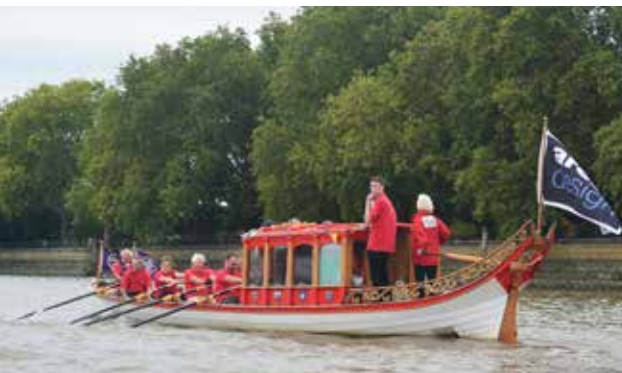
Een schitterende roeiboot met kajuitpassagiers passeren we.