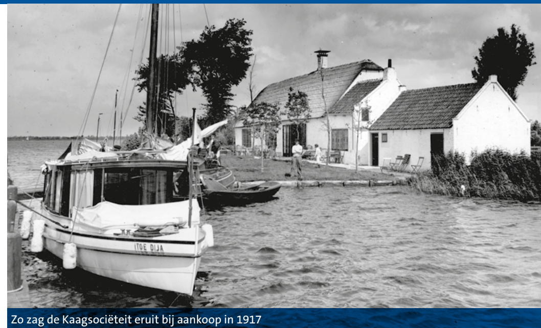
Zo zag de Kaagsociëteit eruit bij aankoop in 1917