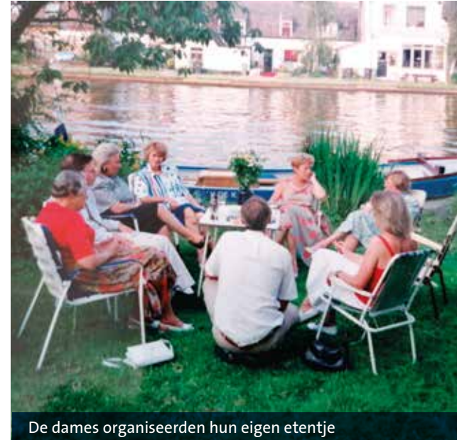
De dames organiseerden hun eigen etentje