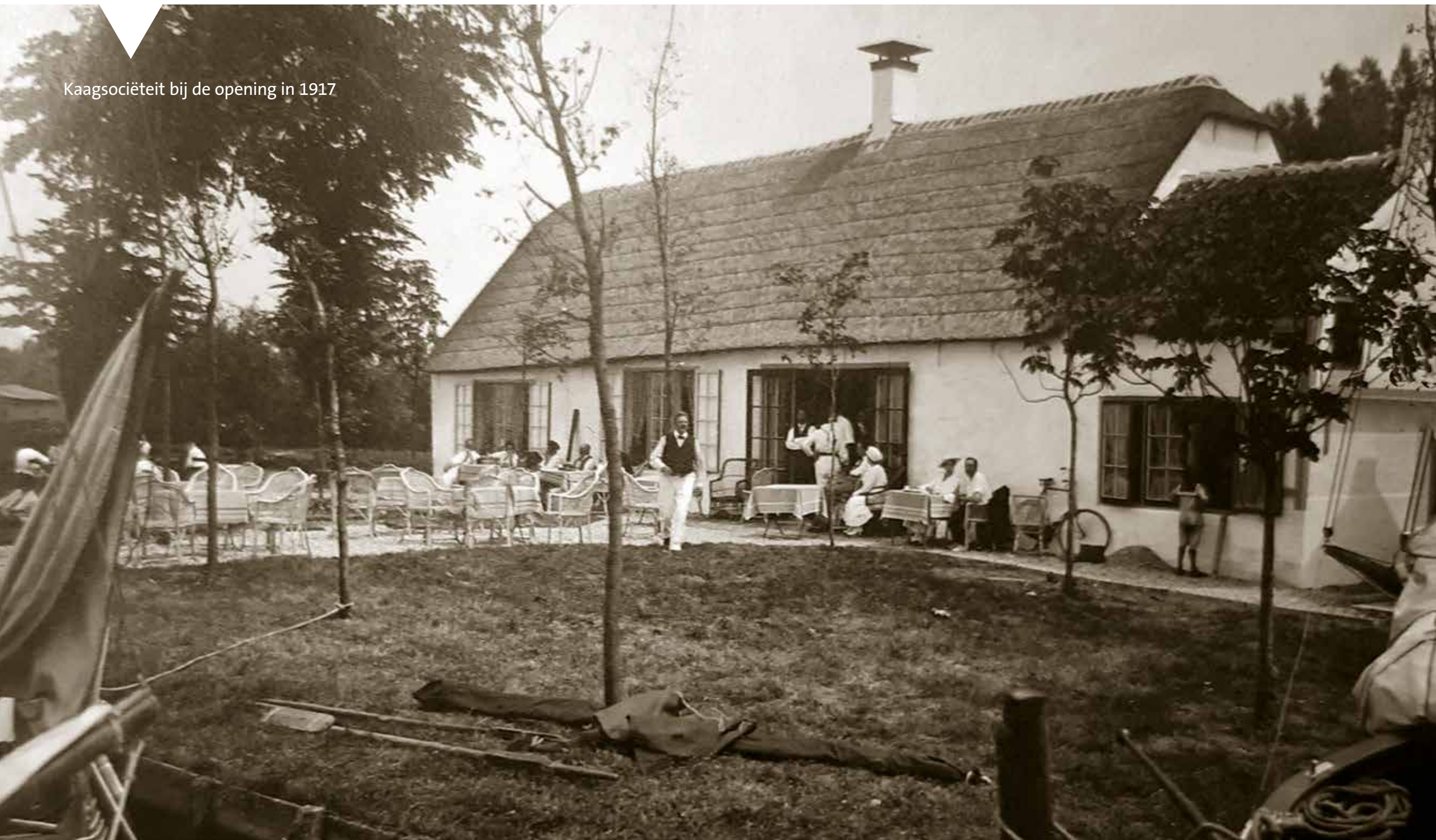
Kaagsociëteit bij de opening in 1917