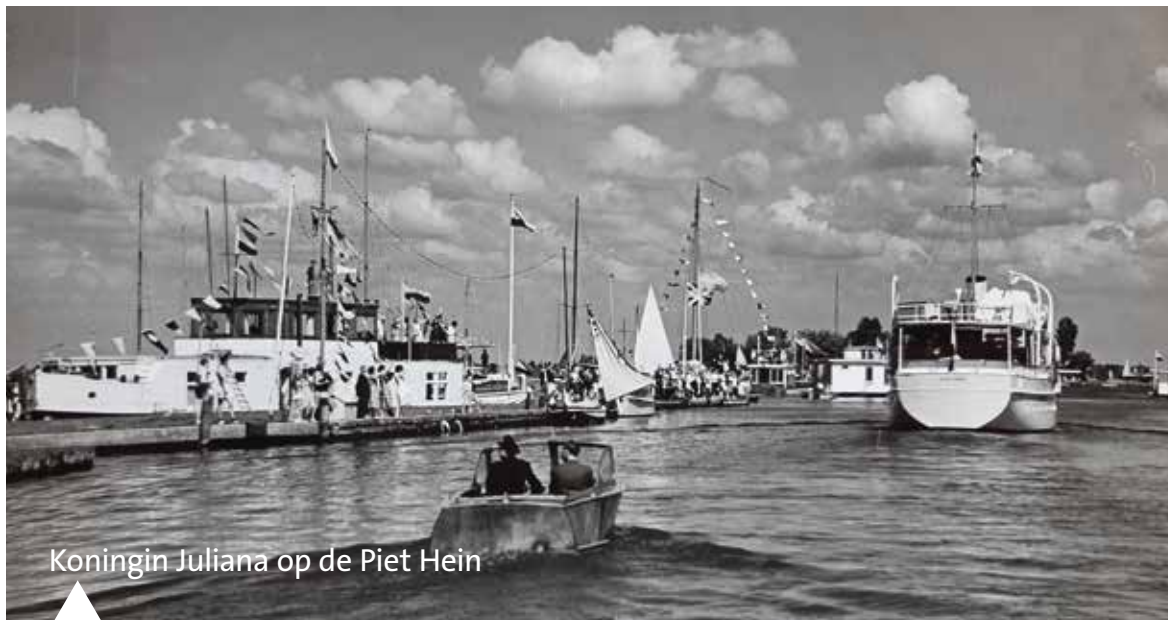
Koningin Juliana op de Piet Hein