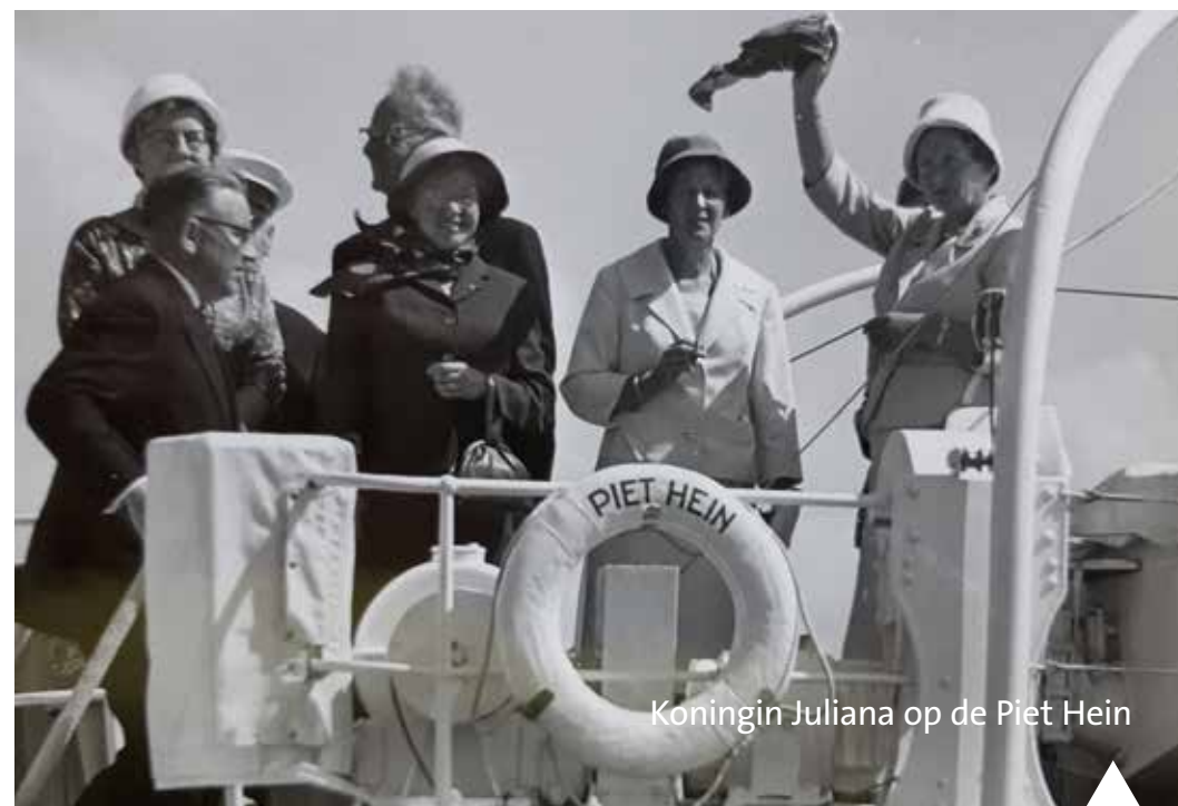
Koningin Juliana op de Piet Hein