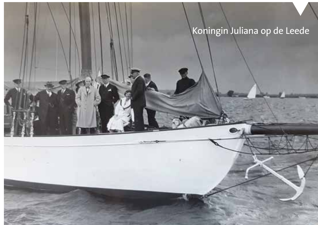
Koningin Juliana op de Leede

Jullie weten hoe het afliep. De zon ging schijnen, het veld hield het, het was een superrace, het feest was top en met wat extra materiaal konden sommige auto's met trailers het veld gewoon verlaten. Daar sta je dan met al je zakelijke ervaring, want de methode ‘komt wel goed, we vinden wel een oplossing’ geeft ook prachtige resultaten. Dank je wel team, het was een mooie ervaring.”