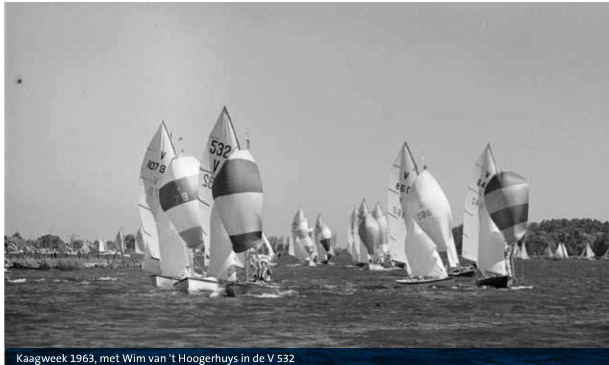
Kaagweek 1963, met Wim van 't Hoogerhuys in de V 532

Je moest een kampeervergunning bij de Gemeente Warmond aanvragen om bij Van Schie te mogen kam-