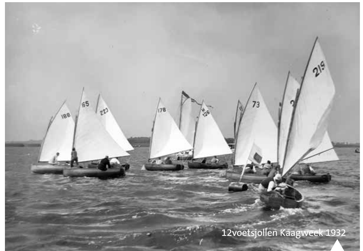
12voetsjollen Kaagweek 1932