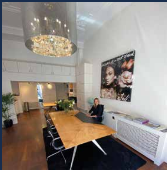
NIEUW! CONDUCT KANTOOR IN WASSENAAR

CONDUCT VASTGOED B.V. E: info@conductvastgoed.com W: www.conductvastgoed.com