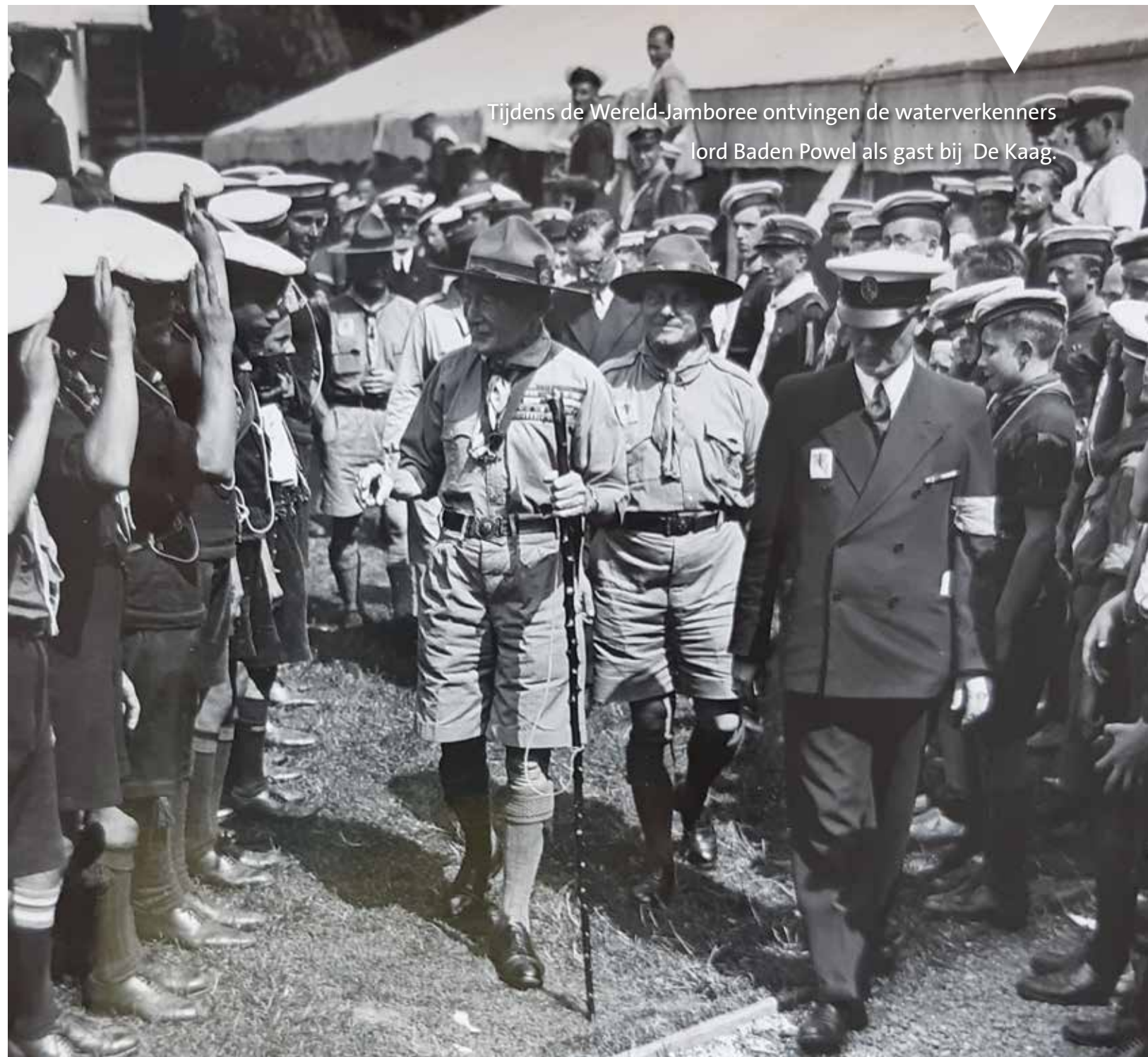
Tijdens de Wereld-Jamboree ontvingen de waterverkenners lord Baden Powel als gast bij De Kaag.