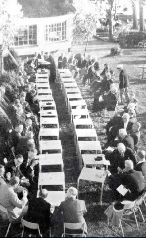
Borrel voorafgaand aan het kaagdiner