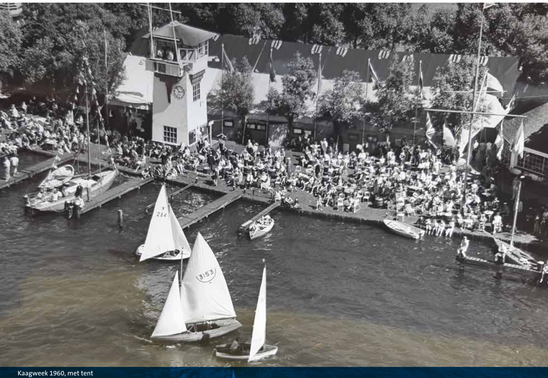
Kaagweek 1960, met tent