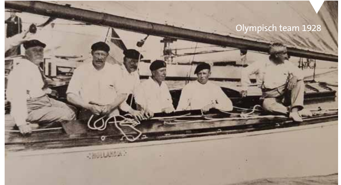
Olympisch team 1928