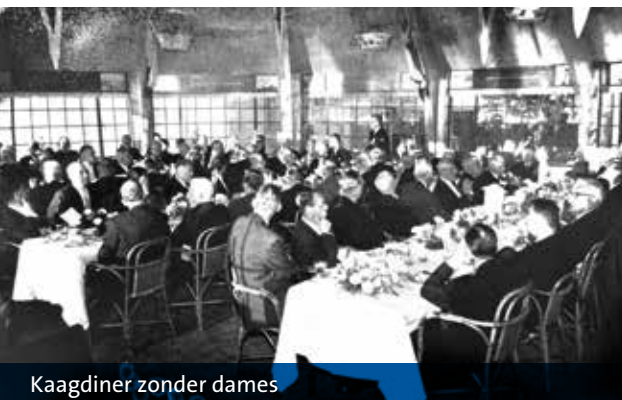
Kaagdiner zonder dames