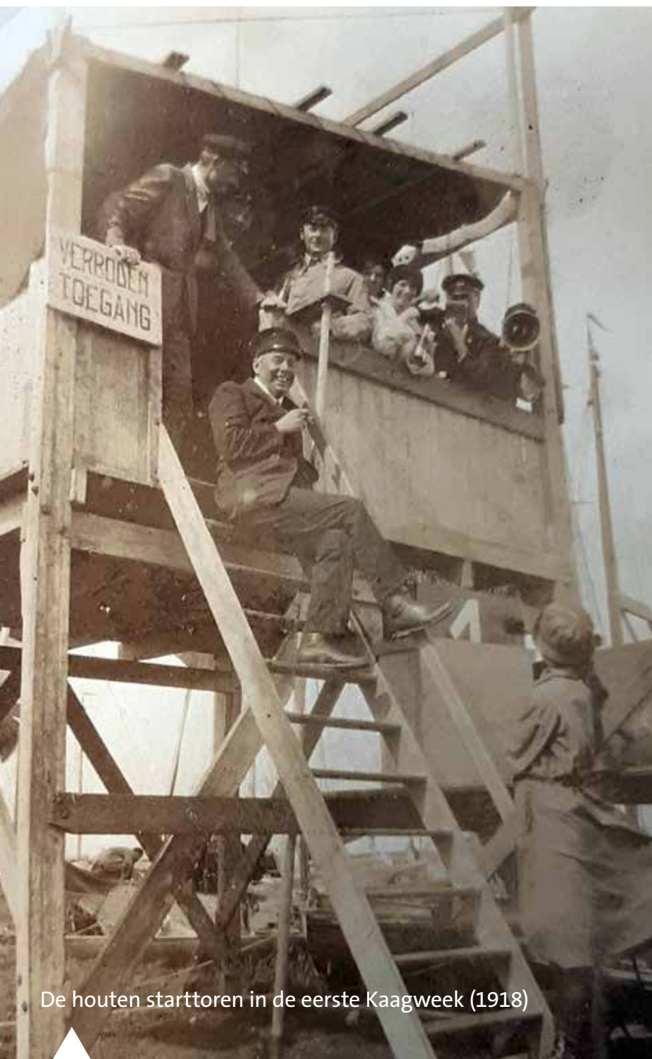
De houten starttoren in de eerste Kaagweek (1918)