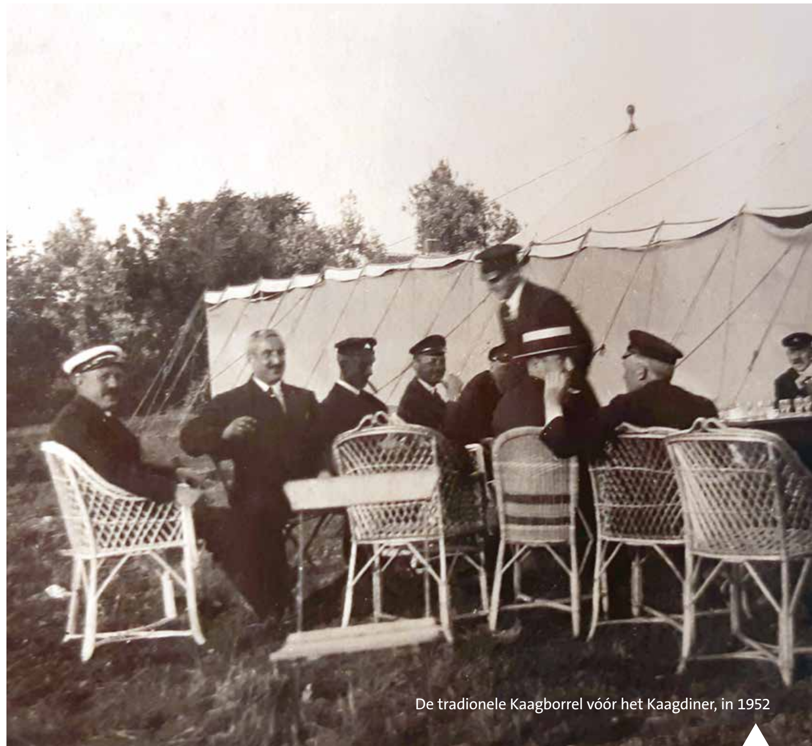
De tradionele Kaagborrel vóór het Kaagdiner, in 1952