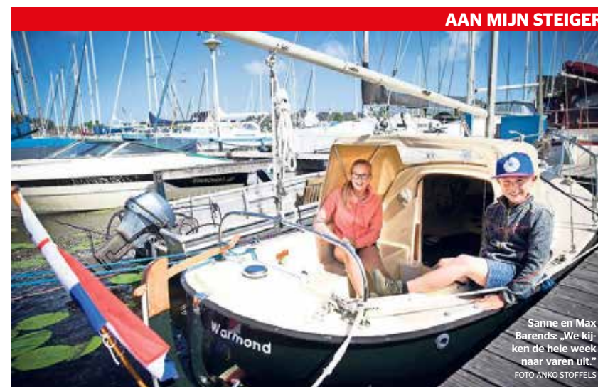
AAN MIJN STEIGER