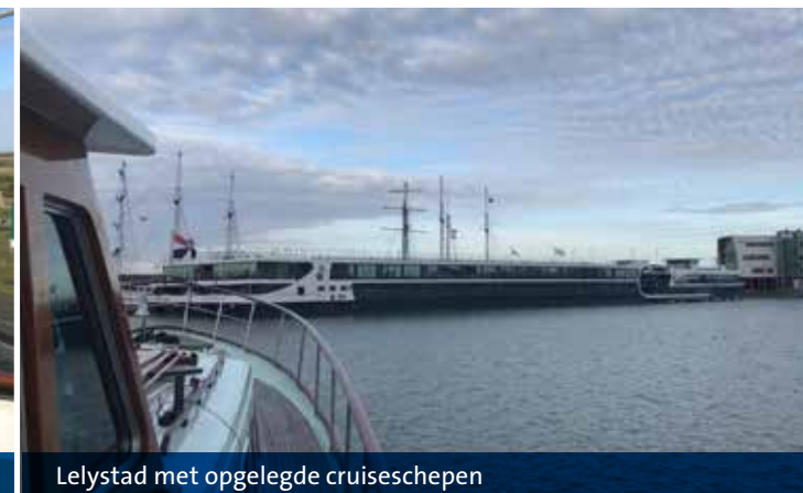
Lelystad met opgelegde cruiseschepen