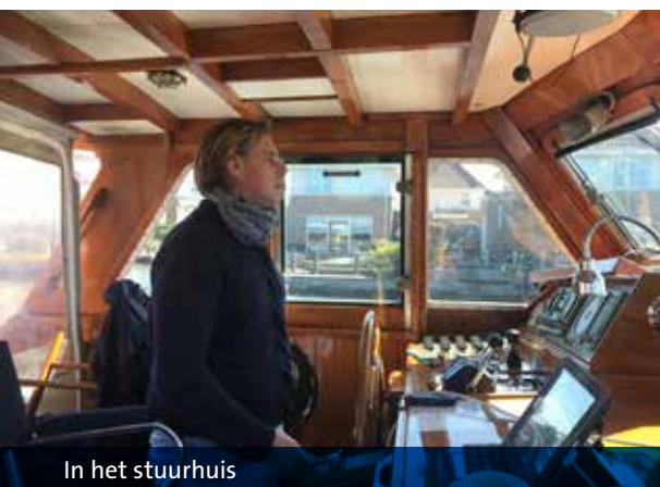
In het stuurhuis

Daar is Aalsmeer, op naar Leimuider. Het is prachtig ➤