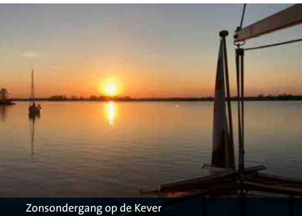
Zonsondergang op de Kever