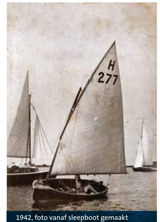
1942, foto vanaf sleepboot gemaakt