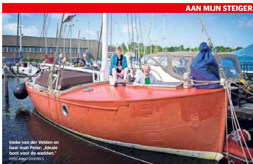
AAN MIJN STEIGER