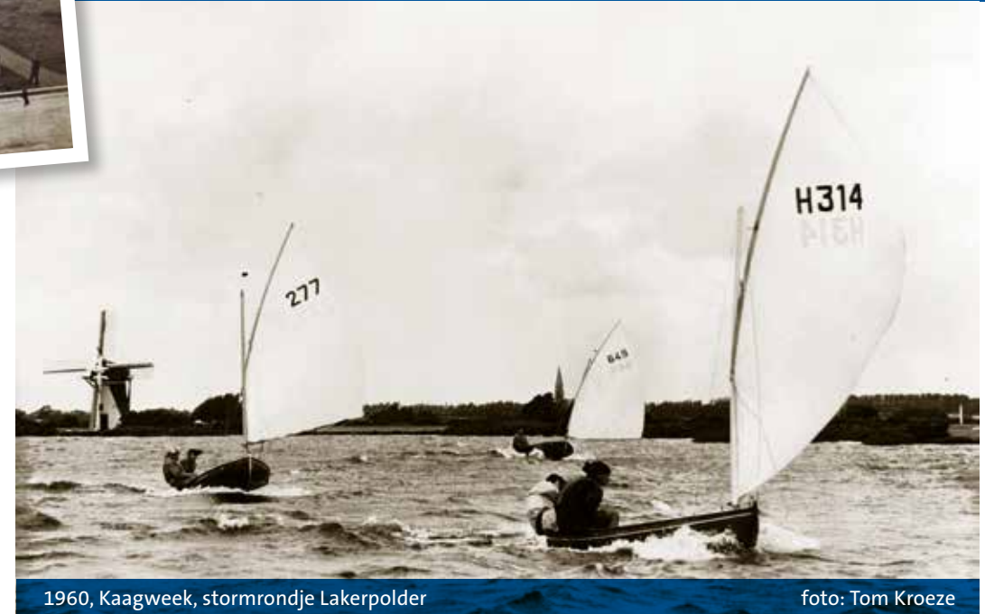
1960, Kaagweek, stormrondje Lakerpolder