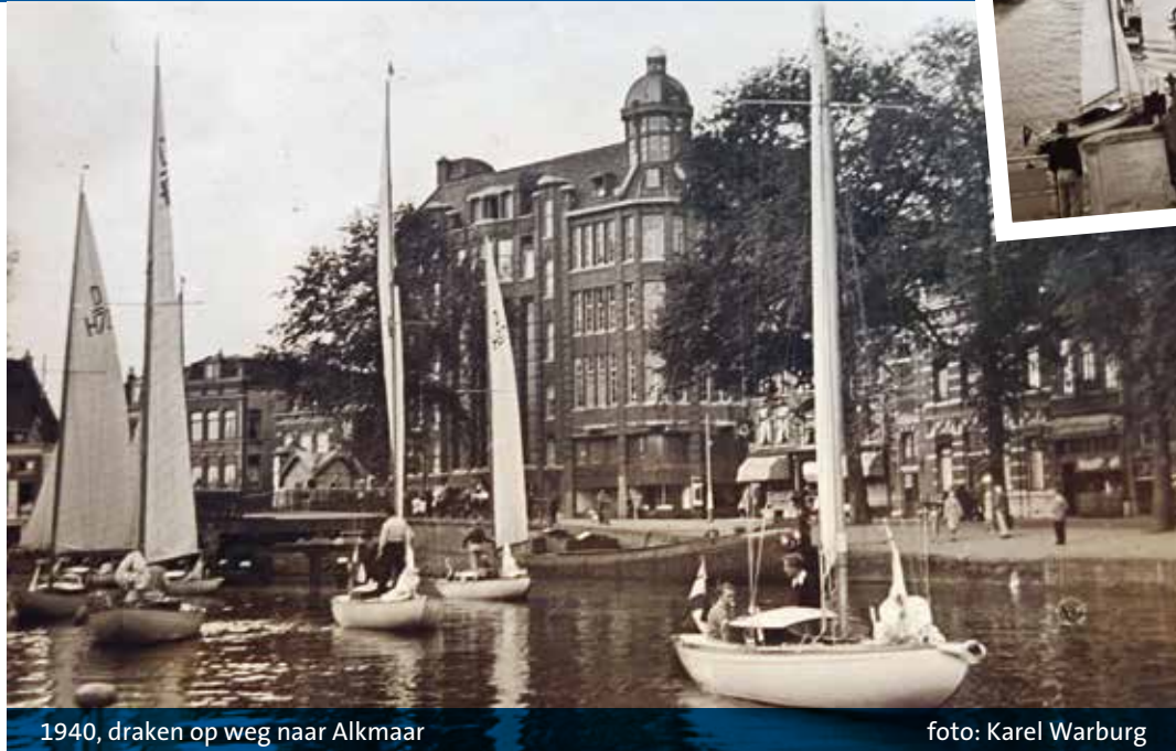
1940, draken op weg naar Alkmaar