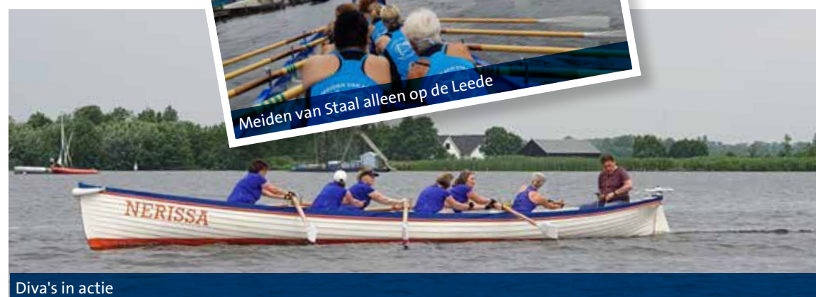
Diva's in actie