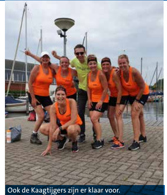
Ook de Kaagtijgers zijn er klaar voor.