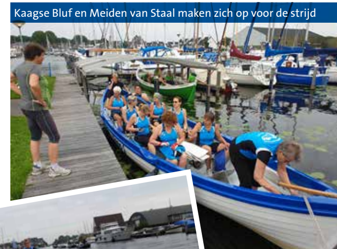
Kaagse Bluf en Meiden van Staal maken zich op voor de strijd