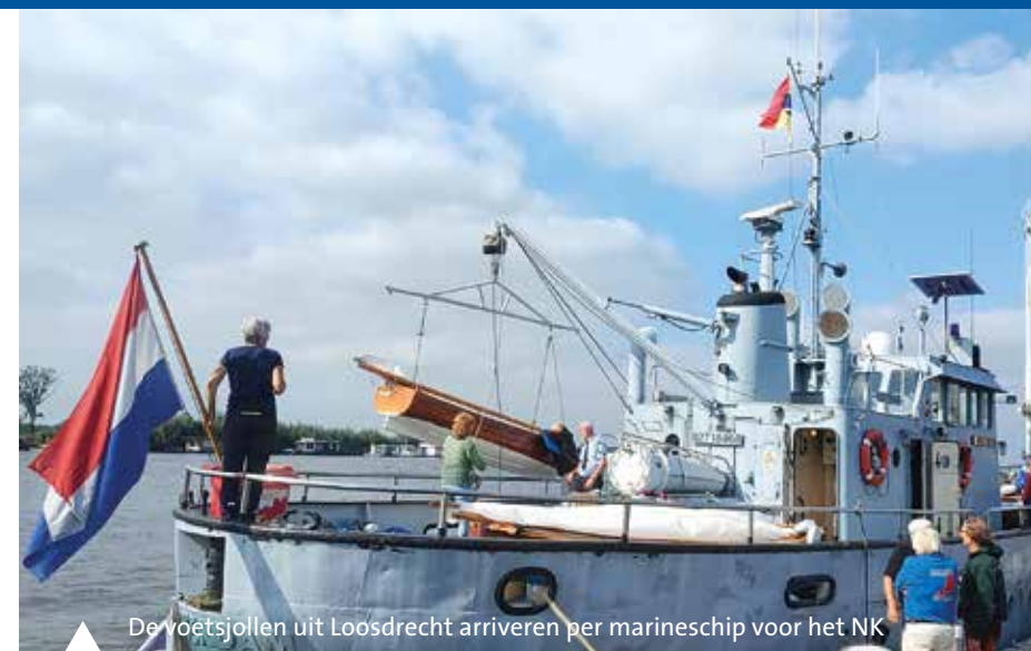
De voetsjollen uit Loosdrecht arriveren per marineschip voor het NK