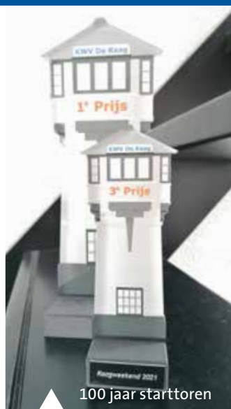
100 jaar starttoren