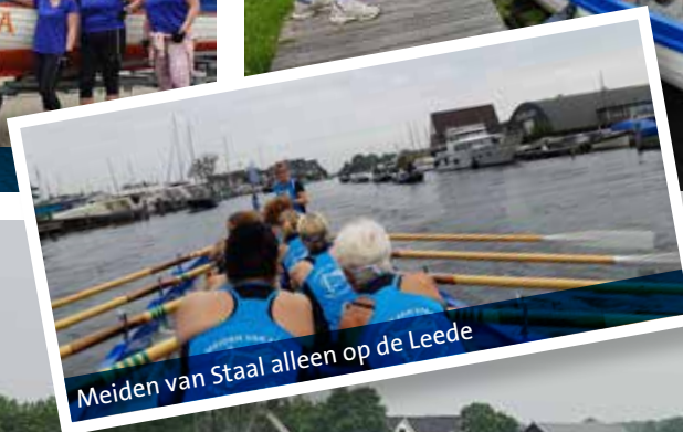
Meiden van Staal alleen op de Leede