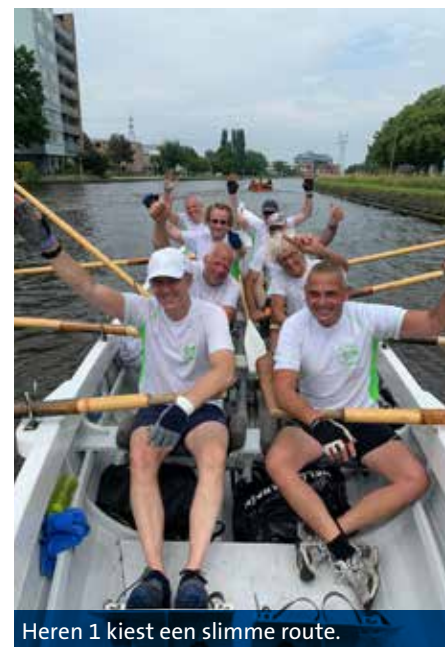
Heren 1 kiest een slimme route.

Vijf Kaagteams deden mee, en iedereen maakte er een rondje van. Dat zijn we zo gewend op de Kaag en we wilden natuurlijk ook langs de Kaagsociëteit varen, terwijl de boten uit haven Oost moesten komen. Maar dat lag niet helemaal voor de hand, want met de noordenwind zou je het beste tien kilo- ›