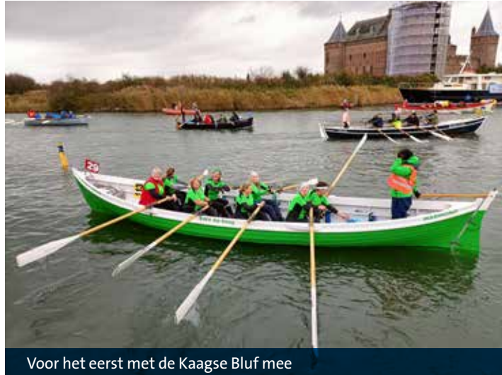
Voor het eerst met de Kaagse Bluf mee