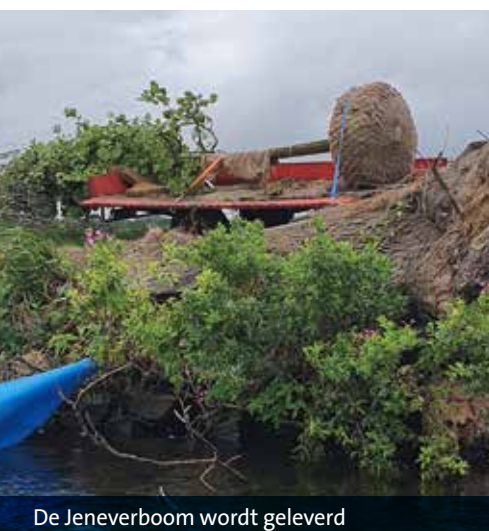
De Jeneverboom wordt geleverd