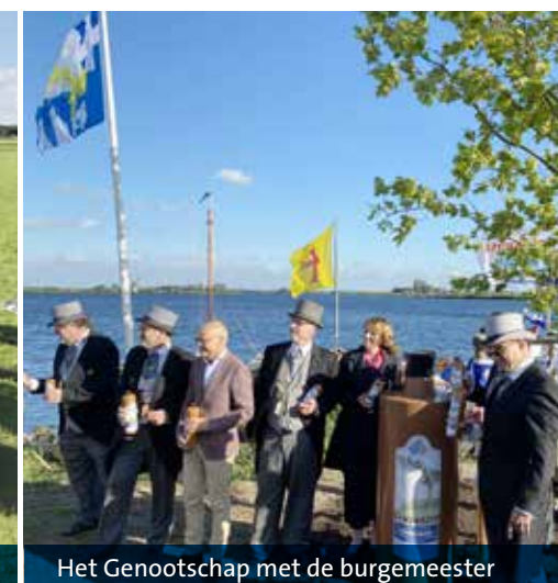
Het Genootschap met de burgemeester