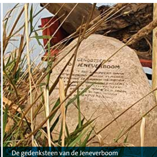
De gedenksteen van de Jeneverboom