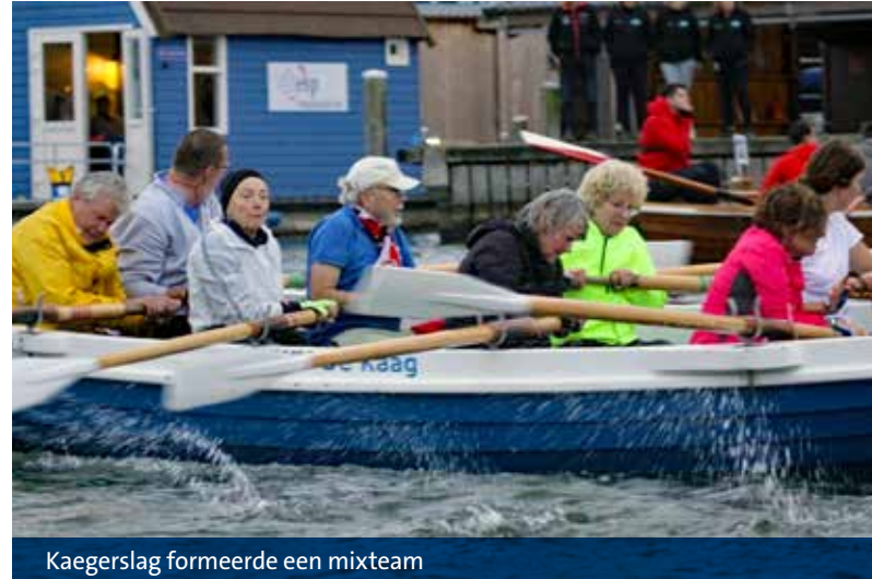
Kaegerslag formeerde een mixteam