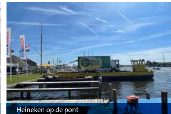
Heineken op de pont