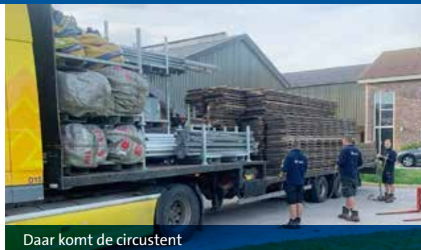
Daar komt de circustent