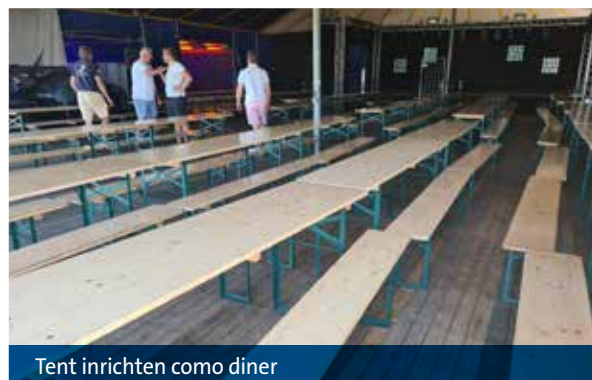
Tent inrichten como diner