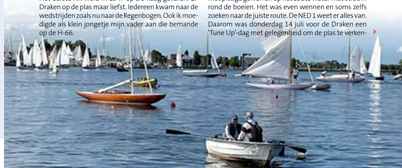
Ochtendstemming bij de Kaagsoos. Crew NED 160 roeit naar het moederschip

Voor menig Draakzeiler is het wennen op De Kaag. ‘Draaien en keren’ op korte rakken op de verschillende poelen met een soort puzzeltocht als te zeilen baan. Duidelijk een ander spelletje dan lange rakken varen met pittige golven en op het zoute water met stroom rond de boeien. Het was even wennen en soms zelfs zoeken naar de juiste route. De NED 1 weet er alles van. Daarom was donderdag 14 juli voor de Draken een ‘Tune Up’-dag met gelegenheid om de plas te verken- ►