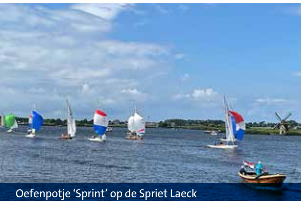
Oefenpotje 'Sprint' op de Spriet Laeck