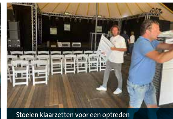
Stoelen klaarzetten voor een optreden