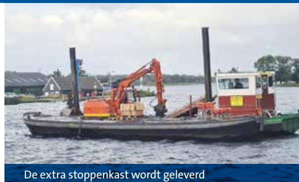
De extra stoppenkast wordt geleverd