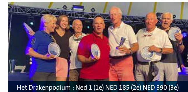
Het Drakenpodium : Ned 1 (1e) NED 185 (2e) NED 390 (3e)