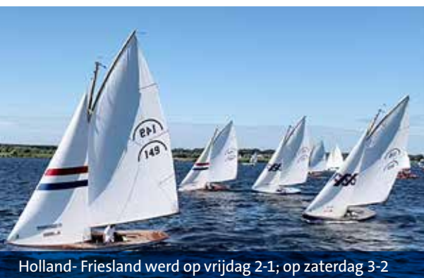
Holland- Friesland werd op vrijdag 2-1; op zaterdag 3-2